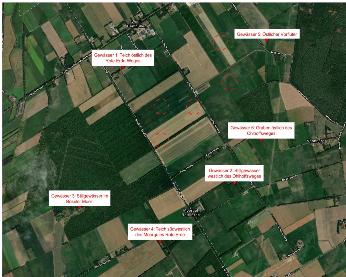
Abb. 2: Lage der untersuchten Gewässer