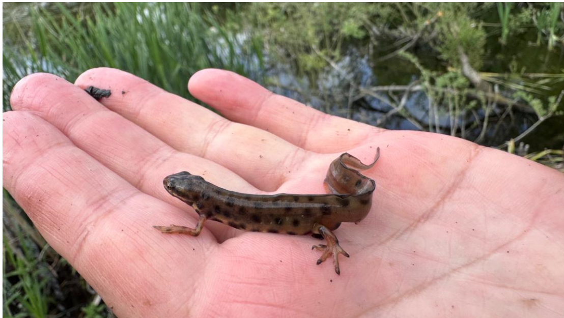
Abb. 3: Teichmolch, mit einer Wasserfalle gefangen und nach der Bestimmung wieder in das Gewässer ausgesetzt (Aufnahme: 18.05.2025,).