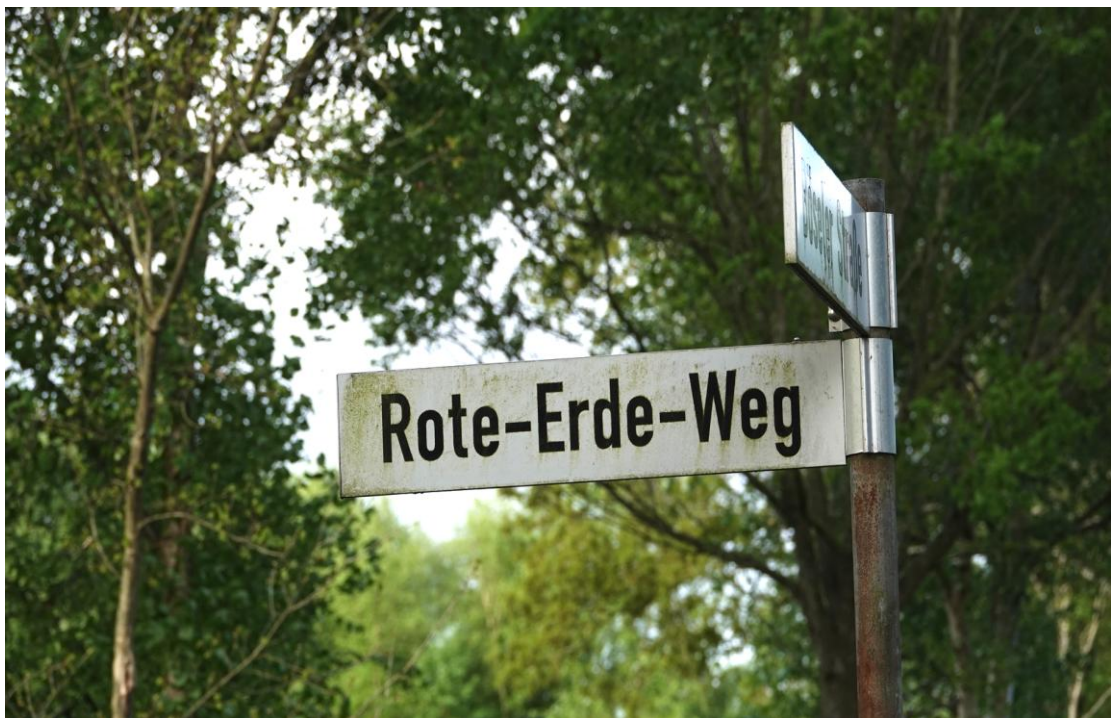
Titelfoto: Rote-Erde-Weg (Aufnahme: 17.05.2025,).

Amphibienkartierung an Gewässern im 600 m-Radius von 5 geplanten Windenergieanlagen